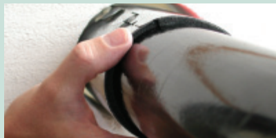
Umieścić BIS Pacifyre na swoim miejscu