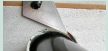
Wypełnić pozostałe przestrzenie

Ogień potrzebuje tylko niewielkiej szczeliny żeby przedostać się, a następnie błyskawicznie rozprzestrzenić się w sąsiadujących pomieszczeniach. Wystarczy zastosować BIS Pacifyre® kołnierz ogniowy aby w przypadku pożaru zamknąć otwór pomiędzy ścianą a rurą oraz powstrzymać działanie ognia i dymu. Dzięki temu drogi ewakuacyjne pozostaną dłużej dostępne a bezpieczeństwo ewakuacji znacznie zwiększone.