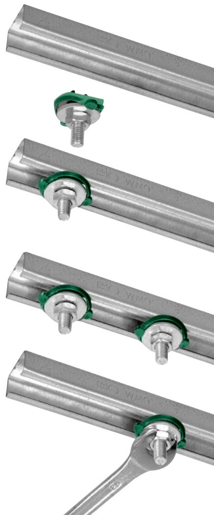
BIS RapidRail® Śruby młotkowe i nakrętki ślizgowe

Tak szeroka paleta produktów zjednoczona w jednym systemie BIS RapidRail® daje instalatorowi nieograniczone możliwości w zakresie lekkich i średnich mocowań. Wszystkie elementy systemu BIS RapidRail® posiadają aprobatę techniczną, która pozwala na ich szerokie stosowanie w branży instalacyjnej. ■