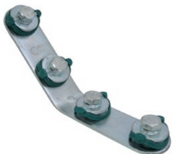
BIS RapidRail® Elementy konstrukcyjne

że są one kompletnie zmontowane i dostępne w bardzo szerokiej palecie rozmiarów pozwalają na ograniczenie ilości kłopotliwych dla instalatora drobnych elementów takich jak nakrętki sześciokątne i podkładki. Specjalna konstrukcja nakrętek ślizgowych i śrub młotkowych BIS RapidRail® pozwala także na szybką i łatwą regulację ich położenia w szynie oraz wysokości na jakiej jest podwieszona rura. Śruby młotkowe posiadają trzpienie gwintowane w różnych długościach co pozwala na ich zastosowanie do każdego rozmiaru rur bez względu na grubość izolacji.