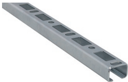
BIS RapidRail® Szyna montażowa