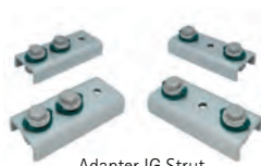
Adapter IG Strut